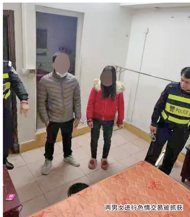
两男女进行色情交易被抓