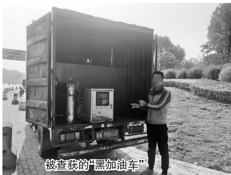
被查获的“黑加油车”

歪脑筋,因交警部门查处非法改装加油车较严,觉得采用厢式小货车非法改装加油车更隐秘,没想到还是被交警逮住了。