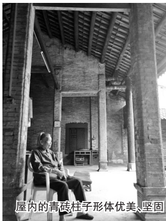
屋内的青砖柱子形体优美、坚固

里面第二进大屋是由6根青砖柱子和2根石柱构成,其中没有墙壁,给人一种空旷通透的感觉。后面两个拱门,也是用青砖砌成。不大,只可容一个成年人通行。正因为其小而显精巧,又因其小巧,走进第一进大屋时,会给人一种“别有洞天”之感。第一进大屋结构相对简单,屋内柱子虽也是青砖砌成,但由于其大而粗,失其柱子之“形”。好在数量不多,看上去还留着柱子之“神”。