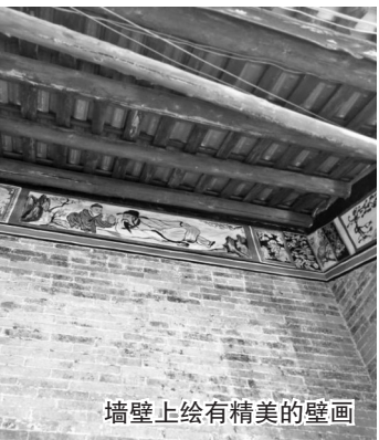
墙壁上绘有精美的壁画