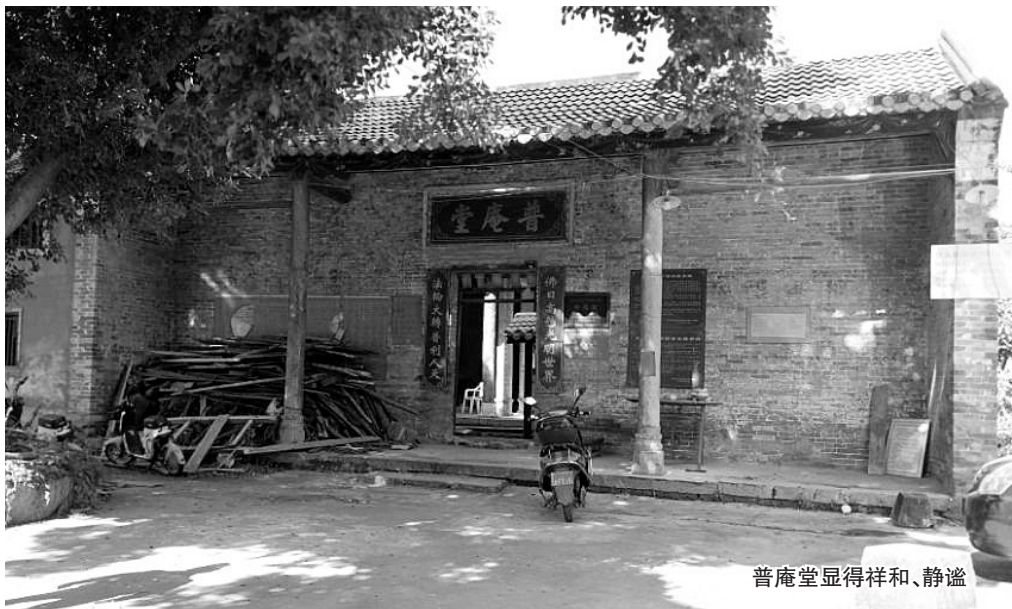
普庵堂显得祥和、静谧

走进里面,我们看见几位老人安然坐于其中,说起普庵堂这座古建筑时,她们脸上现出自豪之色,“这是玉林最古老的建筑之一,每年都有不少外地游客到这里参观。”她们说,上世纪二十年代,普庵堂曾作为学堂使用。解放后,成了南观小学二校区,朗朗书声延续了半个世纪。1993年,普庵堂被玉林市政府列为“玉林市重点文物保护单位”。