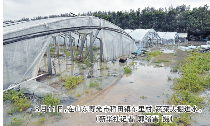
8月11日,在山东寿光市稻田镇东里村,蔬菜大棚进水。

东、河北、天津、辽宁、吉林、黑龙江等地一线,指导协助当地采取针对性防御应对措施,全力做好台风防御应对和抢险救援各项工作,此前已紧急向浙江预拨救灾资金3000万元。