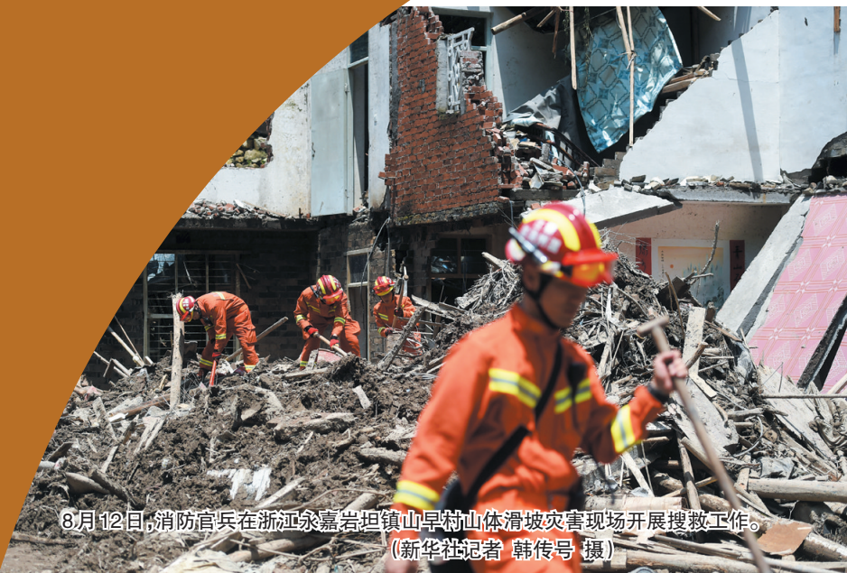
8月12日,消防官兵在浙江永嘉岩坦镇山早村山体滑坡灾害现场开展搜救工作。

国家防总12日派出工作组分赴辽宁、河北,指导协助当地开展防汛防台风工作。应急管理部对山东紧急启动国家救灾应急响应,并应山东省要求,调派一架重型直升机前往参与抢险救援工作。