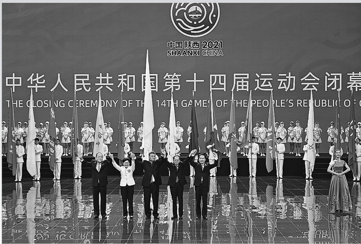
▼9月27日,演员在闭幕式上表演。