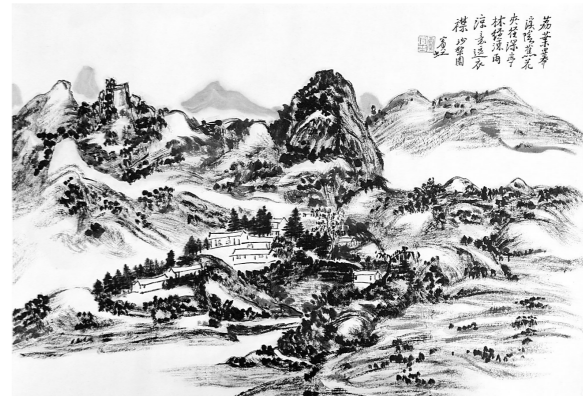
沙梨园 (张向明 临)

黄宾虹题诗: 荔叶翠溪阴,蕉花夹径深; 亭林经冻雨,凉意逗衣襟。 冯 振题诗: 此是吾家数亩园,沙梨已老久无存; 年来手种新桃李,绕屋扶疏子渐繁。