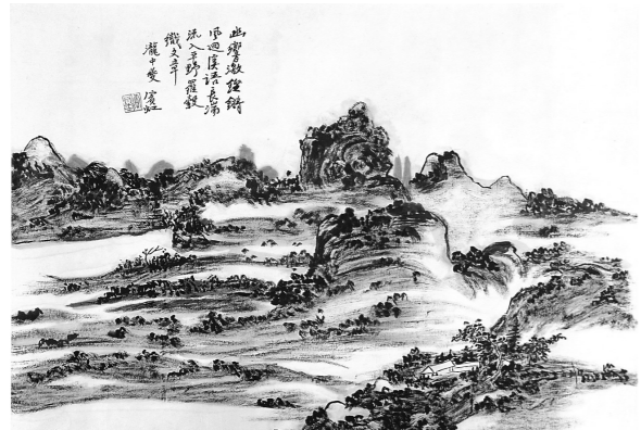
泷中夔 (张向明 临)

编者按: 在中国当代美术界有“北齐南黄”之说,“北齐”指的是闻名遐迩的一代大师齐白石,“南黄”指的就是山水画一代宗师黄宾虹。 黄宾虹两次畅游北流,并即兴创作了数幅以北流美景为题材的画作。这些画作,不仅艺术地记录和描绘了北流的自然美景,同时承载着与北流人的深厚情谊,弥足珍贵。特别是1935年夏季,黄宾虹应北流籍学者冯振、陈一百等之邀,到冯振老家山围畅叙,由此创作出诗文互答与绘画写生结合的“山围八景图卷”,艺术价值独特。正如北流籍画家张向明所说,“北流和山围的山水景点,因为黄宾虹先生的画作,得以广泛传播,而北流和山围乃至广西的文化沉淀,因为有了黄宾虹先生的光临和描绘,也显得更加的厚重和辉煌”。近来,张向明悉心赏析并敬临这些画作,以特殊的形式,表达对黄宾虹先生的仰慕、崇敬之情。现将这一跨越时空的艺术对话刊载,供读者品鉴。