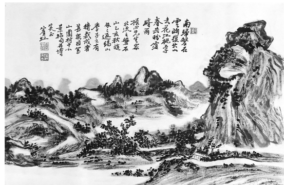
磐石云 (张向明 临)

张向明: 冯振先生家族在山围算是大族,而沙梨园正是冯振先生冯姓族系中一枝的称谓。故冯振先生题此画的诗是:“此是吾家数亩园,沙梨已老久无存;年来手种新桃李,绕屋扶疏子渐繁。”沙梨园之景在黄宾虹先生眼中,也是美不胜收,他在此画上题诗是:“荔叶翠溪阴,蕉花夹径深;亭林经冻雨,凉意逗衣襟。”中国画,诗中有画,画中有诗,已是共识。成功的画家,无不是知识层面较高的文人雅士之流;而作为文人雅士,是要有修行与修为的。画者,文之极也。不读书就没有文,也很难提画的境界。中国画有文野之分,也最忌甜俗,而去俗无法,唯有多读书。而黄宾虹正是非常重视读书的书画家,其对书法与绘画所提出的理论,至今仍是书画界的理论高峰。此幅沙梨园的画作,即是黄宾虹诗、书、画、印都结合得非常好的作品。