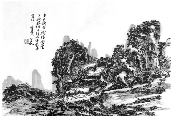
磐石山 (张向明 临)

张向明: 此幅作品所画之山围村,应包括了磐石山、泷中夔、沙梨园等景点,故其山体笼罩较广,房子画得方正宽大,一条黄土大道从画的中部穿过,沿着山脊蜿蜒伸入群山之中,水面空间以及天空等均有悠远之意。远处,巍峨的大容山脉蜿蜒相围;近处,磐石山等数峰高耸,山脚下的村庄不远,一只渡船静泊湖岸边;湖外,是多彩而喧嚣的世界。山围八景的图卷中,只有此幅图卷的水面画了一只小船,它不是隐士垂钓用的小渔船,它是一只渡船。我在深读这幅图卷后,慢慢地感悟到了画家的深意。这只泊岸的渡船,不但是点景之须,更是构成了一种内外联系的无尽张力,象征着山围与外界联系的枢纽作用。山围村,它不是陶渊明所描绘的世外桃源,它是和外界有着紧密联系的人才输送之地。天长日久,小船渡出去或渡进来,不知有多少国内外的学者、军人、骚客文人、商贾僧道、贩夫走卒……而黄宾虹先生于冥冥中也许会觉得,像山围这样人才辈出,山围村,是不会沉没于历史长河之中的。我们再来看看画上的题诗:“斗绝石成寨,周遭山若环;灵源知不远,好作武陵看。”诗中“好作武陵看”一句,正是黄宾虹先生对画面所赋予的遐想。武陵,地处洞庭湖的西部,是历代王朝开发西南的门户,景色秀丽,又是江南闻名的“鱼米之乡”,是古代南北的交通枢纽,又是上溯黔东南,下达苏皖的运输通道。山围的环境,很像武陵的景色,从这里的水路下去,或可通到武陵;从武陵下去,就是苏皖了;而皖地,正是黄宾虹先生的家乡啊。这一幅画,就寄托了黄宾虹先生的精神期盼。冯振先生的题诗为:“万绿千苍拥一村,山环水绕绝尘喧;桃源本是人间世,难得高人把榻论。”山围村虽然有陶渊明描写的桃花源般的气氛与美景,但还是飘散着人间烟火的现实世界,在这样的美景中,如果能与高深学问的人来相互论谈,那该是多么美好的享受啊。