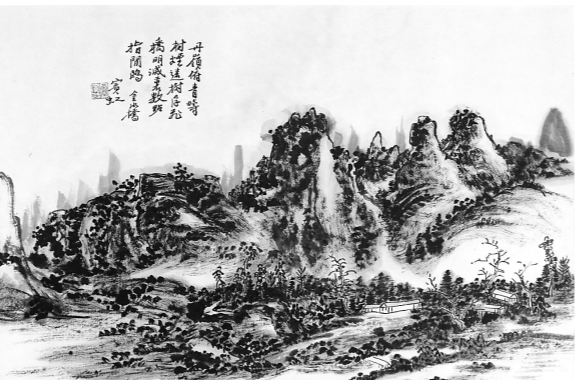
金水桥 (张向明 临)

张向明: 黄宾虹先生在山围八景图卷的第八幅有记:“振心先生家北流之磐石山。”可知磐石山乃冯振先生老家沙梨园之依傍也。从画中观其景色,山中与山脚有房舍俨然,还有栏杆数围,一条石级之路沿缓坡直通屋前,而屋舍的空旷之地连接着一条进山的傍溪山路,葱茏的磐石山后则有奇秀之远山相围相拥。宋代诗人唐庚曾有诗句:“山静似太古,日长如小年。”人处静山之中,可以体会到那山间太古之气息。黄宾虹先生是一个极纯粹的中国笔墨画家,对于中国画描绘时间甚或人生的永恒感问题是体会极深的。故此其画在布局上以古意出之,在山水草木的描绘上,以铺水之法表现山体的温润与委婉;又在铺水之上,以枯笔焦墨,斟酌篆隶之法,写意画山体树木灌丛。故此画于温婉中透出一种粗莽迷蒙,别具一格的气势和高格。此画上的题诗是:“老去将军树,婆娑荫子孙;根蟠千仞石,云散便当门。”而冯振先生题此画诗为:“一峰独秀碧无俦,中有千岩万壑幽;尚有人家水西住,浅霞斜日下羊牛。”