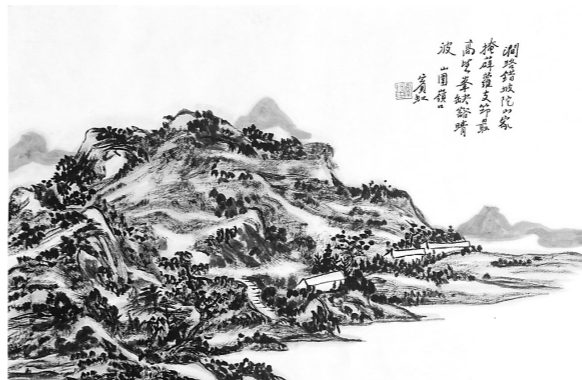
山围岭口 (张向明 临)

张向明: 关于此幅画面构图,黄宾虹先生在其题画诗中已有记述:“众壑水争喧,分流绕果园;林阴云暮起,深处一寻源。”左边大山之间,房舍、树木高耸,一条从山顶跌宕而下的飞瀑布局在画面左侧,而右侧是以枯笔皴擦的缓坡与湖水相接。山脚下则是成排蜿蜒的树木灌丛。此画虽有飞瀑之响,但描绘的仍是一个寂静的山间景点。画家打造的仍是自己心目中的远离尘嚣的山居之地。北宋画家郭熙说:山水有可行可望,又有可居可游。可行可望,是人处客观而欣赏山水,可居可游则是人处其中而融入了山水的境地间。黄宾虹先生此画的含意,应是以可居可游为其心目中的画面而进行了写实性创造。先生老家在安徽歙县,其地也属南方景色,时年已七十岁高龄的画家也许在作画时勾起了对家乡的怀想。冯振先生对此画的题诗为:“乱山深处一溪来,倒泻明珠万万堆;不必夜窗风雨至,墙东隐隐有轻雷。”读此诗更可识画面之形象也。