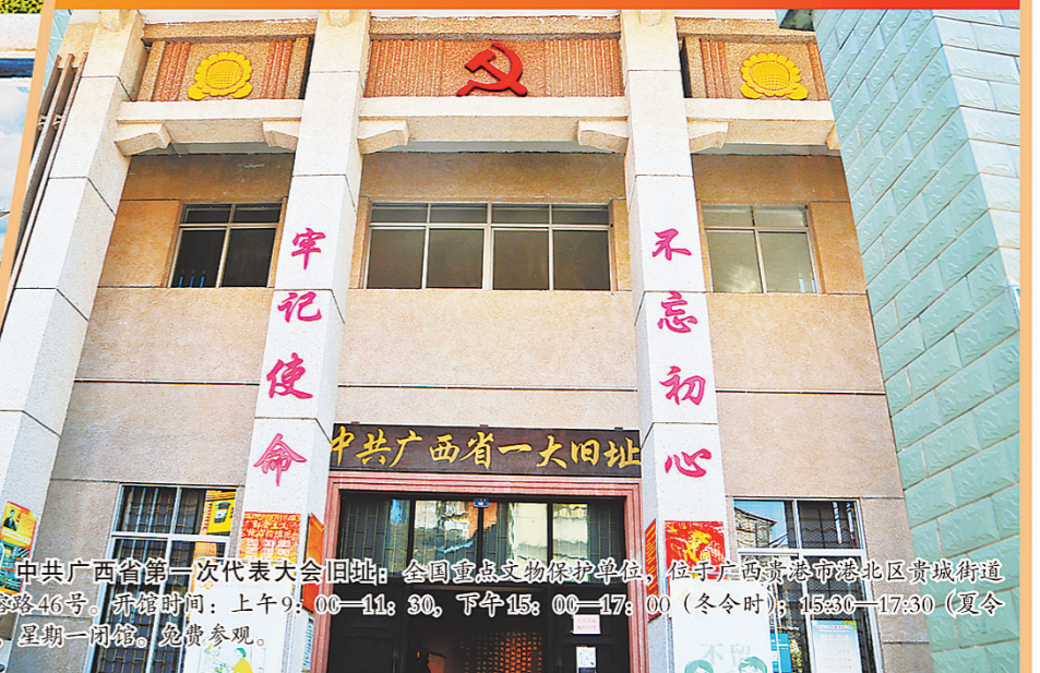
中共广西省第一次代表大会旧址: 全国重点文物保护单位,位于广西贵港市港北区贵城街道古榕路46号。开放时间:上午9:00—11:30,下午15:00—17:00(冬令时);15:30—17:30(夏令时),星期一闭馆,免费参观。