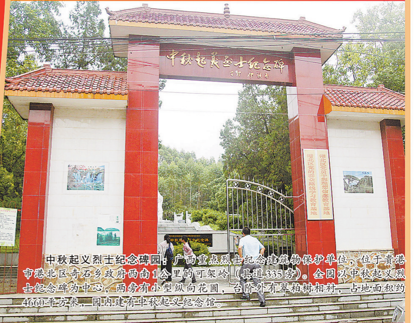
中秋起义烈士纪念碑园: 广西重点烈士纪念建筑物保护单位,位于贵港市港北区奇石乡政府西南1.5公里的可架岭(县道335旁)。全国以中秋起义烈士纪念碑为中心,两旁有小型纵队花园,台阶外有革命烈士群雕,占地面积约4660平方米,是国内首个中秋起义纪念馆。