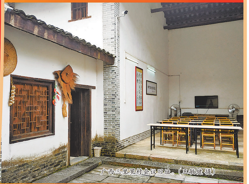
广西三里罗村会议旧址。