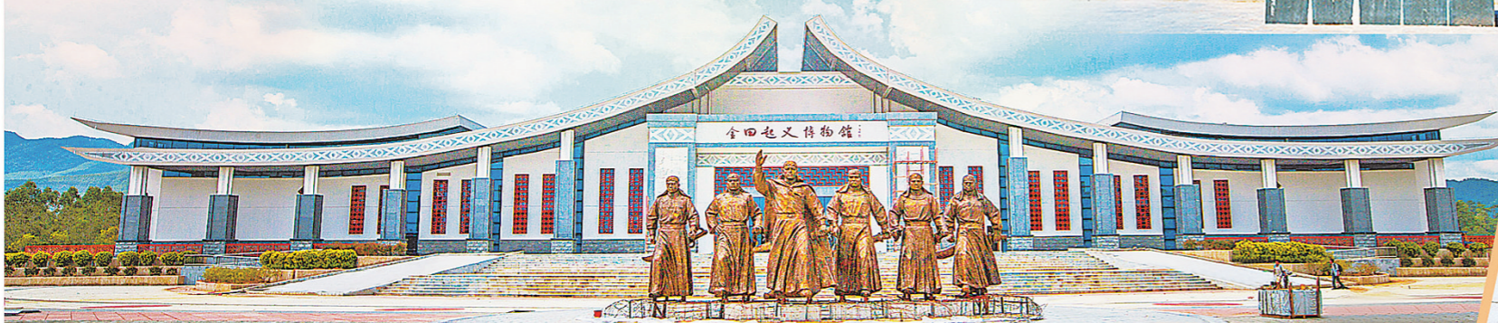
太平天国金田起义地址景区: 国家AAAA级旅游景区、全国红色旅游经典景区、第一批全国重点文物保护单位。景区位于桂平市金田镇金田村,主要包括古营盘、练兵场、拜殿石、犀牛潭、凤回塘古战场、韦昌辉故居遗址、冯云山传道遗址、太平军前线指挥所遗址、三界庙和傅家寨、金田起义博物馆等景点。