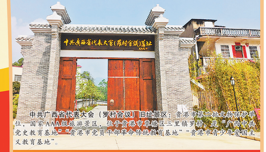
中共广西省代表大会(罗村会议)旧址景区: 贵港市第二批文物保护单位,“国家AAA级旅游景区”,位于贵港市覃塘区三里镇罗村。是“广西中共党史教育基地”“贵港市党员干部革命传统教育基地”“贵港市青少年爱国主义教育基地”。