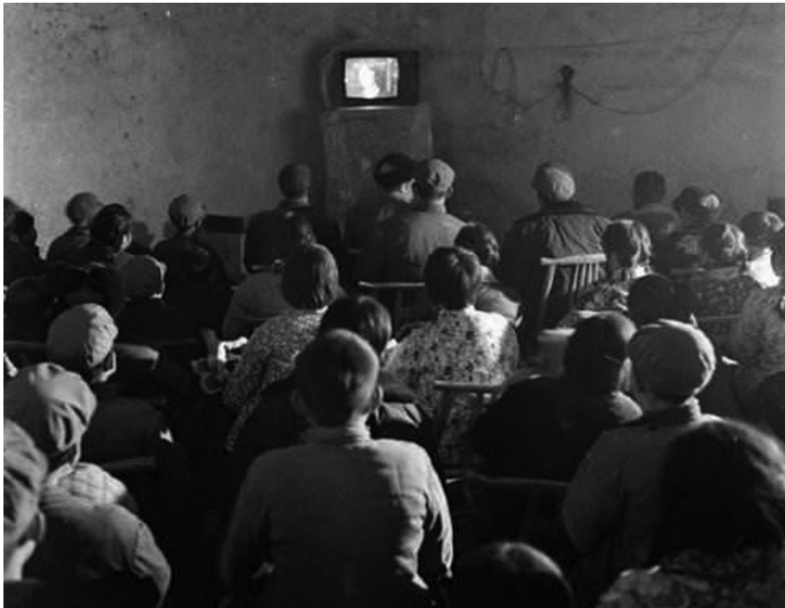
20世纪80年代村民看电视的情景。(资料图片)

我家在北流的一个偏僻闭塞的小山村里。小时候,去一趟镇上都不容易。村里的广播时断时续,有时候干脆整个月一声不响。露天电影一个月看不上一次。我很难了解外面的世界。听说世界上有一种东西叫电视机,能看到遥远的城市,也能看到古人的生活。学校里有人曾经见识过这种玩意,活灵活现地给我们描绘它的神奇。