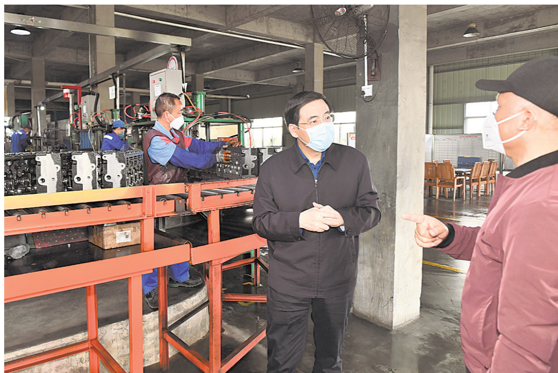
2月13日,市委书记、市疫情防控指挥部指挥长黄海昆走进广西嘉德机械股份有限公司,检查指导企业复工复产情况。

目前,广西嘉德机械股份有限公司、广西旺峰机械科技有限公司、广西明旺食品有限公司、安费诺嘉事达电子系统(玉林)有限公司都已复工,生产车间内,机器声轰隆隆作响,戴口罩的工人们正忙碌在生产线上。“复工人员怎么安排上班?”“职工上班后怎么用餐?”“企业有哪些防控措施?”每到一家企业,黄海昆都仔细询问,详细了解企业复工复产、疫情防控等情况;当走进部分企业食堂,看到一张张饭桌之间的用挡板隔开、有的拉大间距,职工实行一人一桌、分批错峰用餐,黄海昆对此给予了肯定。他指出,企业要高度重视疫情防控,从严从实、落地落实做好防控工作。要制定方案有序组织务