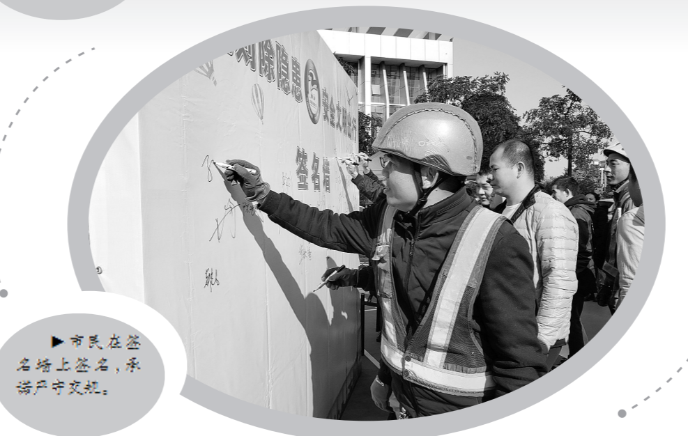
▶市民在签名墙上签名,承诺严守交规。

本报讯(记者 曾维栋)驾驶员代表宣誓、发放交通安全宣传物品、集体签名……12月2日,以“守规则除隐患,安全文明出行”为主题的2019年全国交通安全(玉林)安全日主题现场活动举办,进一步营造良好的交通环境。