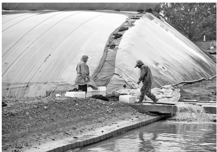
▲8月12日,在寿光市纪台镇东方西村,受灾菜农加紧排出大棚积水。

降雨最大值。由于一年来的灾后重建,河道行洪顺畅,当地干部群众防灾得力,使得寿光目前灾害减小。针对寿光再次受灾,在寿光进行抗洪抢险技术指导的资深水利专家张在发认为,最根本的原因是超标洪水。潍坊普降特大暴雨到特大暴雨,尤其是处于弥河上游的临朐、青州、昌乐平均降雨量均达到特大暴雨级别,且多为山区、丘陵,汇流速度快。寿光为平原区,河道落差小,虽然经过上游水库最大限度的调蓄、削峰、错峰,但上游来水流量仍然很大,加之寿光本身降雨量也达到特大暴雨级别,已经大大超过河道行洪标准。