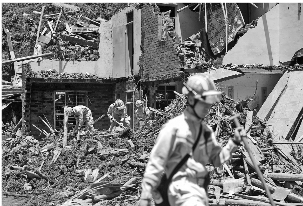
▲8月12日,消防官兵在浙江永嘉岩坦镇山早村山体滑坡灾害现场开展搜救工作。