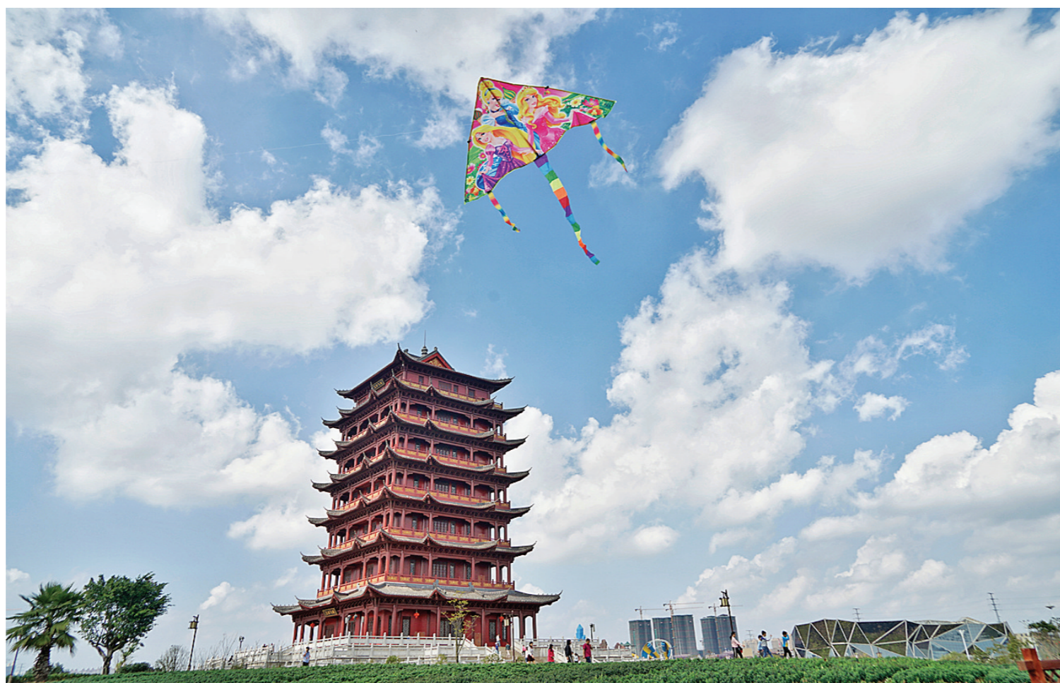
▲大年初二,“玉林蓝”来了,市民在玉林园博园放风筝。(冯涛摄)