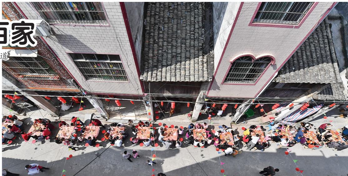
▲300张圆台在圩上如长蛇阵般展开。

百家宴,百家齐聚宴百家。2月8日大年初四,容县杨梅镇杨梅圩的街坊邻居在圩上摆起了百家宴,共贺新春佳节。