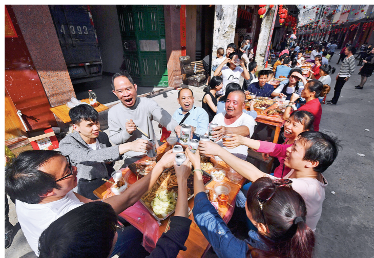
▲街坊邻里开怀畅饮,畅叙乡情。