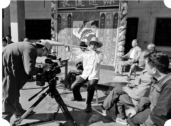
央视摄制组拍摄现场。

行走乡村村落,记录千姿百态的风土人情、体验不同的生活习俗,见证历史的传奇文化,三天的六靖之行虽然短暂,但六靖人的热情、对传统文化的专注和热爱,给央视摄制组留下了深刻而难忘的印象。六靖这个有着深厚历史文化底蕴的古镇,在央视摄制组的拍摄录制下,必将在世人面前绽放它惊艳的美。